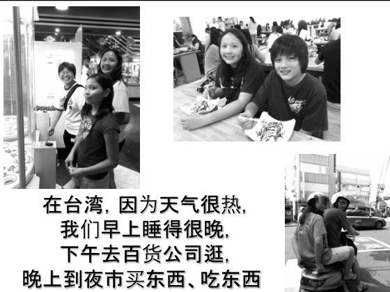
在台湾，因为天气很热， 我们早上睡得很晚， 下午去百货公司逛， 晚上到夜市买东西、吃东西